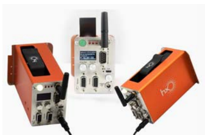
TIJ Hx Nitro

Согласование скорости движения продукта и скорости подачи этикетки. В комплекте с мерительным колесом.